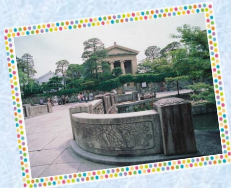
倉敷美観地区（大原美術館）