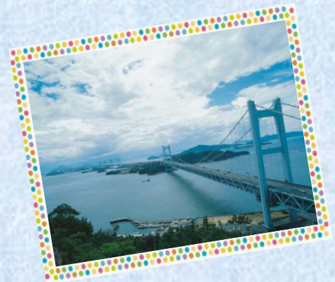
瀬戸大橋（岡山側から）