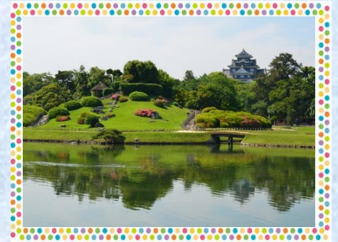
岡山後楽園（日本三名園の一つ）