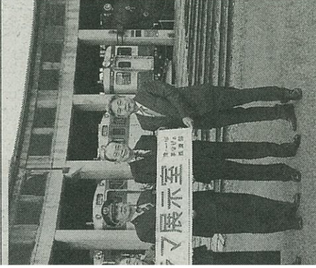
鉄道館で行われた贈呈式