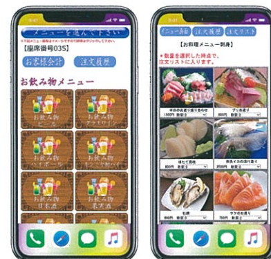
メニューカテゴリーを表示