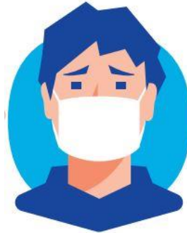
マスクを着用する