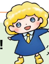
パート・有期法イメージキャラクター「ばゆうちゃん」

正規社員と非正規社員の待遇に違いがある場合は、待遇の違いが働き方や役割の違いに応じたものであると説明できますか？