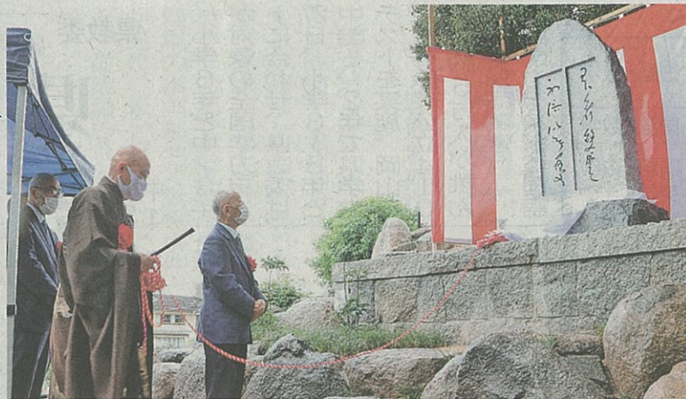
仁保住職(右から2番目)ら関係者により除幕された、良寛の書を刻んだ石碑