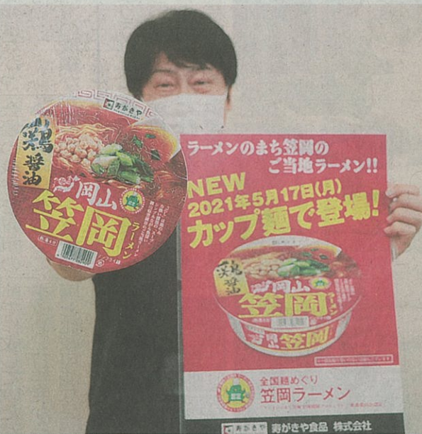
全国発売された笠岡ラーメンのカップ麺

笠岡を代表する「当地グルメ」笠岡ラーメン(愛知県豊明市)が、地域のラーメンとコラボする「全国麺めぐり」シリーズの一つとして商品化、全国発売された。即席麺メ