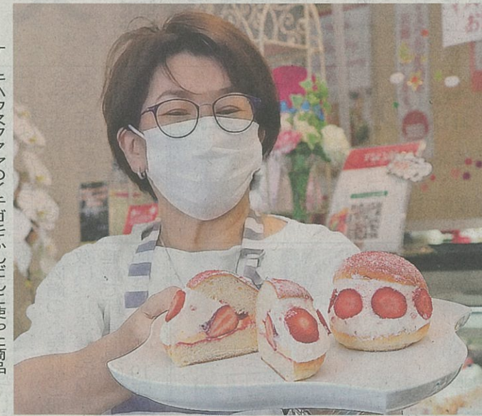
ケーキハウスフクヤのイチゴをふんだんに使った商品

「映える」と注目 岡山で販売次々 創業74年の老舗洋菓子店「ケーキハウスフクヤ」(同市北区中央町)は3月下旬から新商品として投入。ショートケーキにも使うさりした生クリームとカスをはさむ女性客をよく目にする」と話す。 同市内では他のパン店やカフェなどでも扱う店が増えており、まさにブームと言え状況のようだ。各店が工夫を凝らした商品を用意しており、お気に入りのマリトッツォを探してみたい。 「ケーキハウスフクヤ」(同市北区中央町)は3月下旬から新商品として投入。ショートケーキにも使うさりした生クリームとカスをはさむ女性客をよく目にする」と話す。