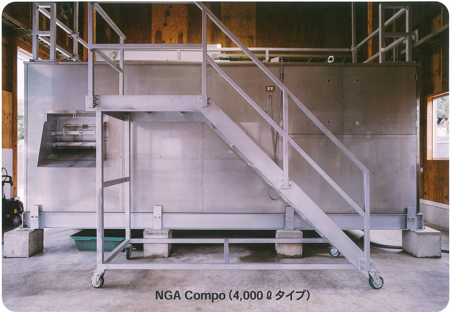
NGA Compo (4,000 L タイプ)

次世代の有機物リサイクルシステムで地球環境の良質化に貢献し、持続可能な地球をつくる一翼を担う