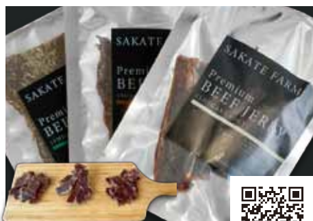
【坂手ファーム】 PREMIUMビーフジャーキー3種セット

嚼めば嚼めほど肉の旨みが出てきて毎日食べても飽きない味です。3種の味が楽しめて、思わずビールが飲みたくなる逸品。