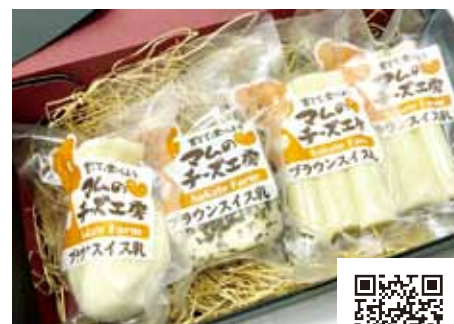
【坂手ファーム】 チーズ3種セット

希少なフランス産牛の新鮮な牛乳を使用し保存料や安定剤を一切使わず手作りの、栄養豊富なこだわりのチーズです。ミルクの風味が豊かでまろやかな味わいなのであっさりして食べやすいのが特徴です。