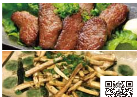
【城下町肉処 櫓】 津山名物 干肉・ヨメナカセット

牛肉のうまみがギュッと凝縮された津山名物干し肉とヨメナカセは、お酒のあてにもよし、おかずにもよしの一品。