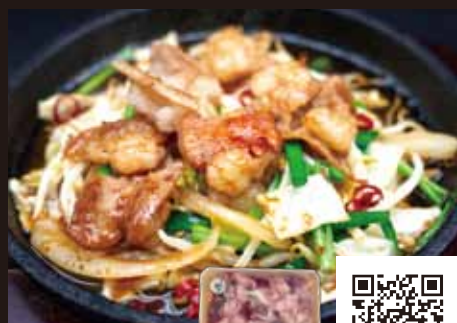
【城下町肉処 櫓】 つやま和牛のホルモン

精肉店直送なので鮮度抜群。新鮮・安全・安心のホルモンはプリプリ食感で、脂の旨みがたっぷり。焼肉や煮物、もつ鍋などお好きな料理でお召し上がりください。