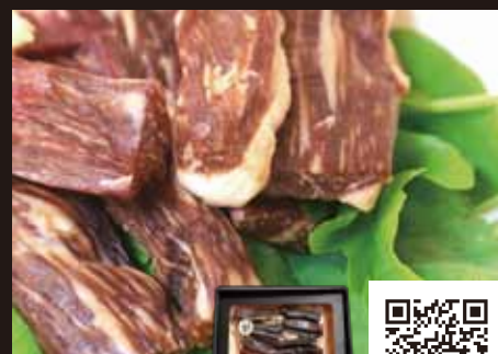
【山本精肉本店】 つやま和牛の干し肉

津山名物「干肉」衝撃のうまさ! 牛肉のうまみに手が止まらない! お酒のあてにもよし、おかずにもよしの逸品!