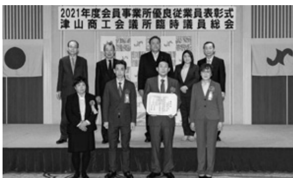
優良従業員表彰（30年）