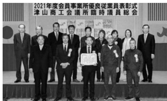
優良従業員表彰（20年）