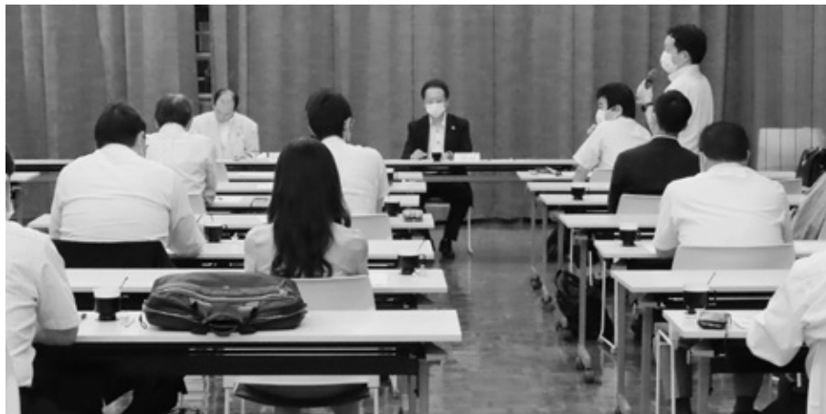
「合同幹事会の様子」

両部会から27名が参加し各企業の現況報告の後、行政に対して、「給付金手続きの簡素化と給付基準の見直し」「飲食におけるガイドラインの提供」などの意見が出された。また、地方創生推進委員会など6委員会の意見を整理し、要望書として津山市に提出した。