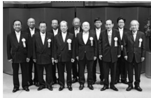
「主管した総務運営委員会」