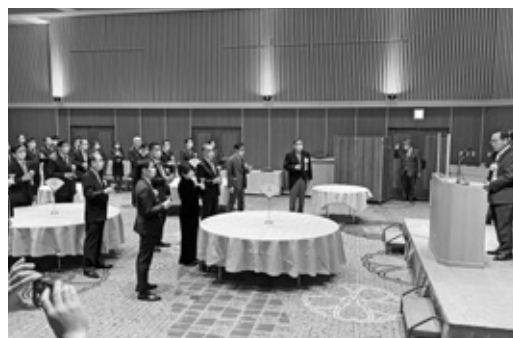
「ノンアルコールワインによる乾杯」