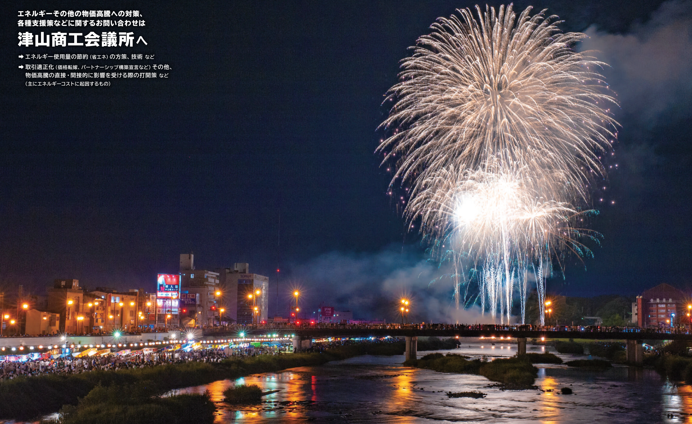
津山商工会議所は、管内中小企業・小規模事業者の事業環境変化対応推進による経営力強化をご支援します。