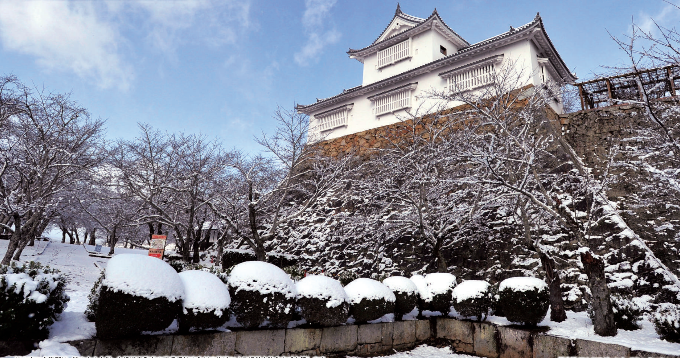
津山商工会議所は、管内中小企業・小規模事業者の事業環境変化対応推進による経営力強化をご支援します。

→ 中小企業等事業再構築推進事業(事業再構築補助金)、 中小企業生産性革命推進事業 (ものづくり補助金、持続化補助金、IT導入補助金、事業承継・引継ぎ補助金)など