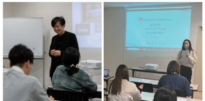
津山まちなかカレッジ C's net 連携講座