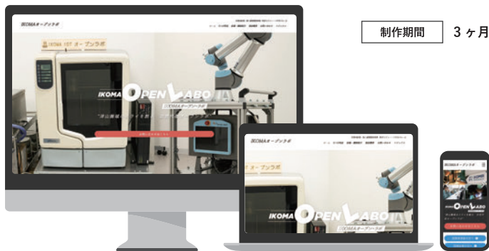
IKOMA ロボテック株式会社さま IKOMA オープン・ラボ URL https://www.ikoma-openlabo.com/