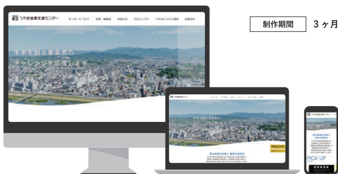
つやま産業支援センターさま センター公式サイト URL https://www.tsuyama-biz.jp/