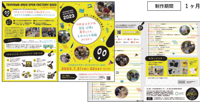
つやま産業支援センターさま つやまエリアオープンファクトリーチラシ