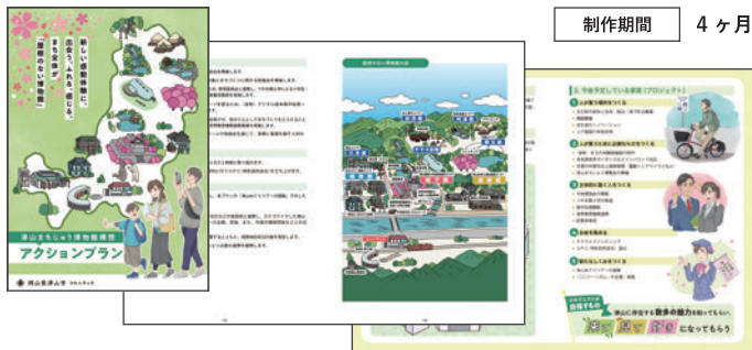
津山まちじゅう博物館コンソーシアムさま 津山まちじゅう博物館アクションプラン 冊子・概要版